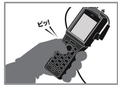
ボタンが押しやすい、水滴がかかっても安心など、業務端末ならではの使い勝手