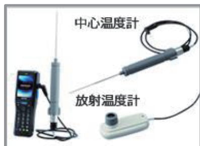
中心温度計・放射温度計に対応