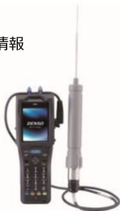
温度センサ対応ハンディターミナル BHT-1306QWB-H