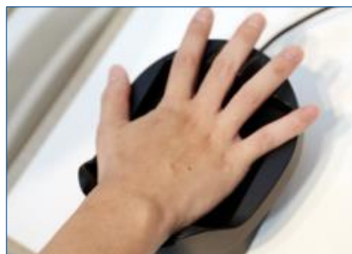
高精度な非接触型生体認証