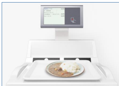
食堂決済との連携も可能