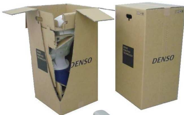
小型精密 ロボット