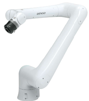
COBOTTA PRO 1300