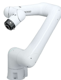
COBOTTA PRO 900