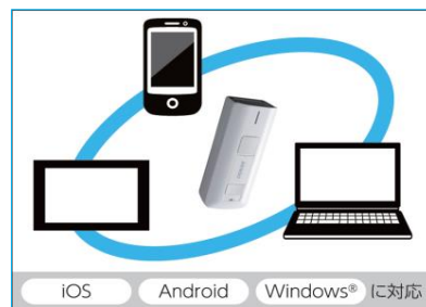
スマートフォンやタブレットと簡単に接続できるので幅広い運用が可能