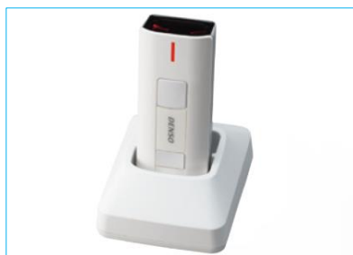
繰り返し使えるeneloop®に対応